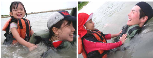
スタッフのお兄ちゃんお姉ちゃんとも仲良くなれたね。