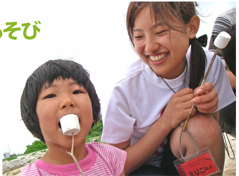
海からあがった後に焼いて食べるマシュマロは、なんでこんなにいいんだらうね。

6月の青空ようちえんは、待ちにまった海遊び。今回の参加は1歳からちびっこまで、親子20名弱。日差しは出なかったけど、海の中はもう夏の暖かさ。1, 2歳は親子で、3歳以上はスタッフのお兄ちゃんお姉ちゃん達と、ライフジャケットをつけて海遊びのスタートだ。砂地の波打ち際で、お船ごっこで遊びながら水に慣れたら、潮が引いて出てきた岩場で、