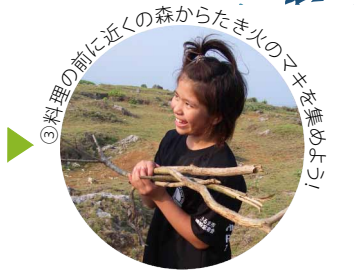
③料理の前に近くの森からたき火のマキを集めよう!