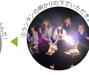
⑤ランタンの明かりの下でいただきます!