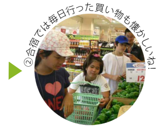
②合宿では毎日行った買い物も懐かしいな!