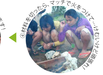
④材料を切ったら、マッチで火をつけて…はちいけど準備!