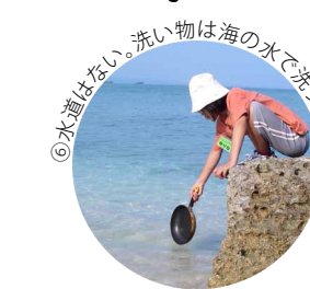
⑥水道はない。洗い物は海の水で洗うんだ!