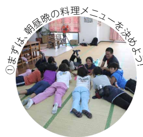
①まずは、朝昼晩の料理メニューを決めよう!